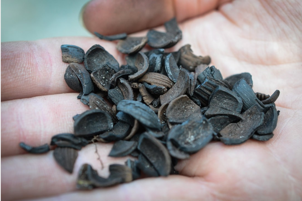
Hasselnötskal, 8700 år gamla Ljungaviken, Blekinge